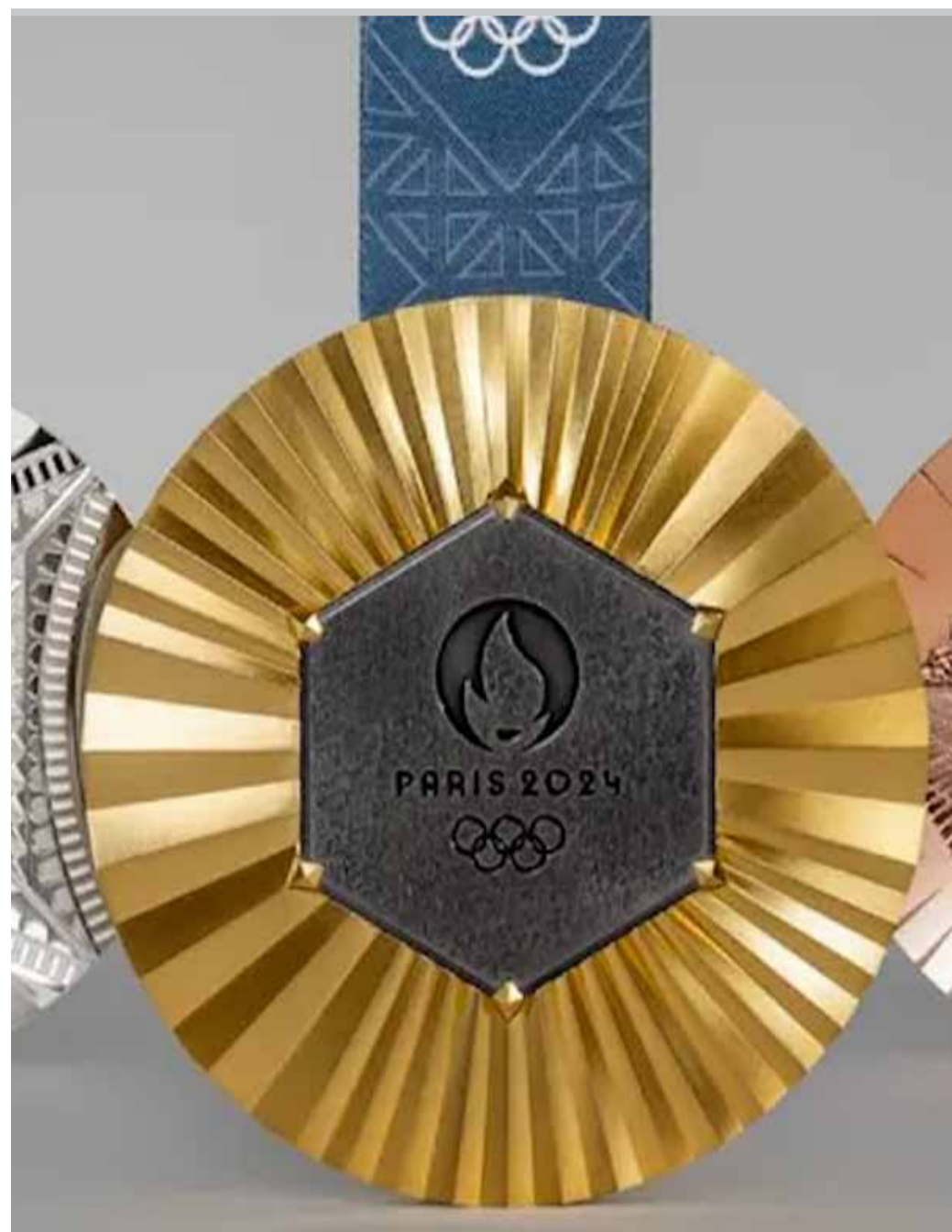
Unes medalles molt especials

París 2024 va recórrer al joier Chaumet de LVMH per dissenyar les medalles