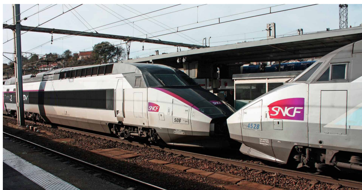
Trens d'alta velocitat aturats

Després del sabotatge de tres línies de tren a la capital francesa, ahir es va recuperar la normalitat. Ara, La policia francesa està investigant el cas per trobar als responsables. Aquest passat dissabte, diversos mitjans de comunicació francesos i internacionals van rebre una carta d'una organització desconeguda reivindicant l'acte de sabotatge.