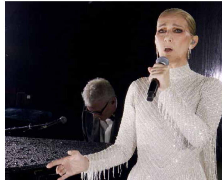
Celine Dion torna als escenaris