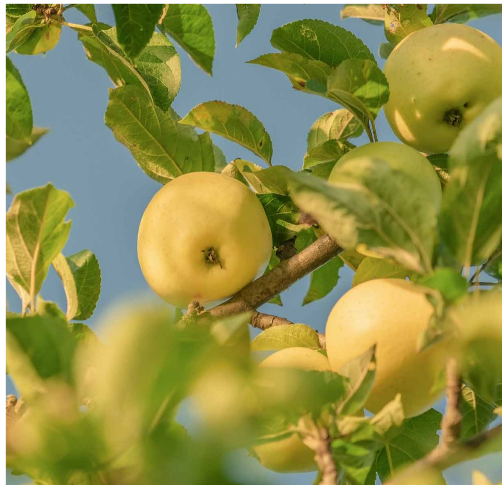
Pomers de Lleida.