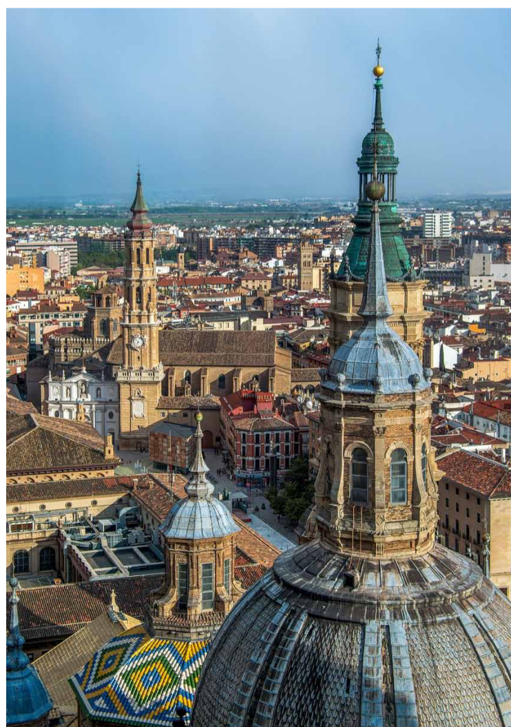
Ciutat de Saragossa.

La corporació ha activat un portal a la seu electrònica municipal amb tota la informació relativa a altes temperatures i on es poden descarregar consells, conèixer la ubicació i els horaris dels refugis climàtics, el mapa de fonts d'aigua potable de la ciutat o el visor d'ombres. Diferents eines amb què la ciutadania pugui adoptar mesures per protegir-se de la for-