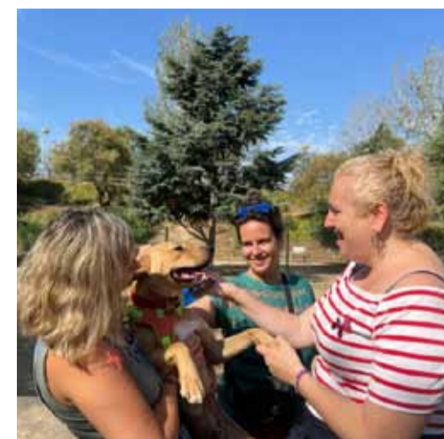
Moment de la presentació de les novetats en la gestió del CRAAM

Des de l'associació «Revolució Pata» juntament amb un educador i etòleg caní s'impartiran formacions als voluntaris on se'ls hi explicaran temes com ara la interpretació bàsica del llenguatge corporal de l'animal, el maneig de les