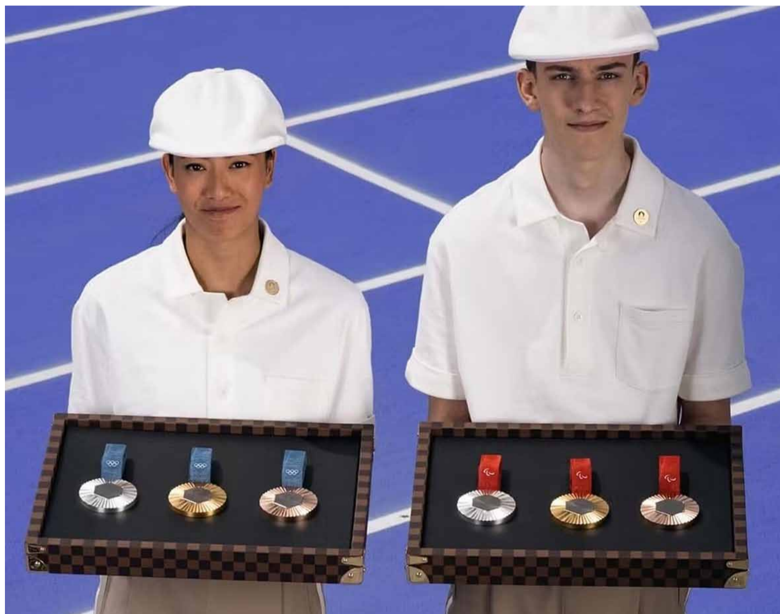
LVMH és el dissenyador de la roba olímpica.

Les safates d'aquestes medalles úniques també les fan artesans de Louis Vuitton al taller de Beaulieu-sur-Layon a la regió de Mai-